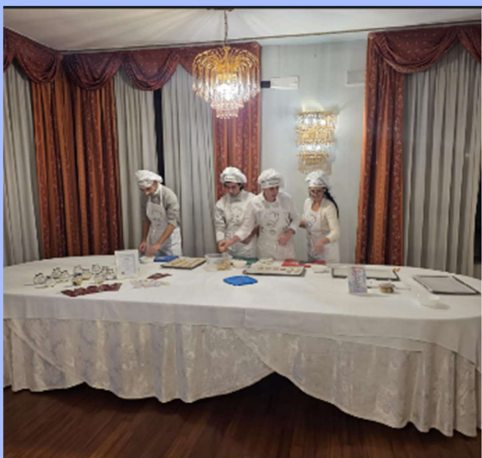
I ragazzi di Mondoabaut e I Sassi di Betania all'opera